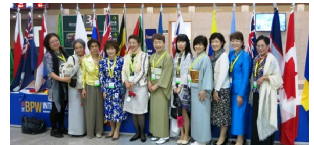
2014年チェジュ・コンGRESS

BPW International (BPWI) は5大陸にわたる100以上の国と地域が加盟、会員数は数万人です。国連の経済社会理事会の諮問機関として、総合協議資格を持つ団体で、国連のCSW(女性の地位委員会)及びILO、UNESCO、UNIFEMに代表を送っています。世界大会(コンGRESS)を3年に一度開催し、世界の女性達に共通する問題を協議・決議しています。